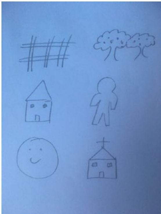
Figiúr a 6

Is féidir fosta ‘dictogloss’ a úsáid le dul siar ar an scéal. Sa ghníomhaíocht seo iarrann an múinteoir nó an léachtóir ar na foghlaimeoirí éisteacht leis/léi ag léamh cuid den ghearrscéal agus pictiúir bheaga a tharraingt