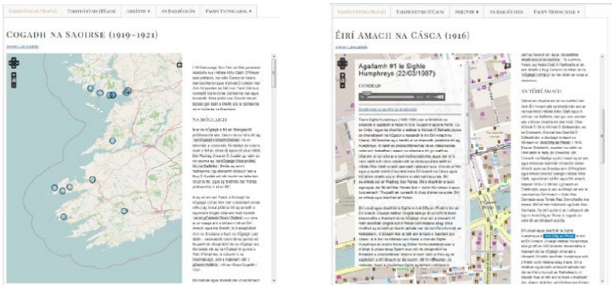
Figiúr 4: Gabháil scáileáin de na haistí staire, mar atá siad léirithe le mapai.

Bhí uainn coimeádaíocht agus anailís dhomhain a dhéanamh ar ábhar na cartlainne agus an anailís seo a chur ar fáil don úsáideoir ar bhealach mealltach agus idirghníomhach. Cuireadh le chéile ocht n-aiste staire dírithe ar mhórthéamaí na tréimhse 1913-1923 4 , ag úsáid an eolais atá i míreanna fuaime an bhailiúcháin. Sna taispeántais seo, díritear ar an bhfianaise uathu siúd a chonaic nó a ghlac páirt in eachtraí stairiúla na tréimhse. Glacadh leis na míreanna fuaime seo mar bhunfhoinsí staire, agus go bhfuil ábhar iontu nach bhfuil eolas coiteann air. In áiteanna sna haistí seo, déantar tagairtí do mhíreanna fuaime ina bhfuil stairithe ag caint. Déantar seo chun comhthéacs níos leithne a thabhairt don úsáideoir. I ngach aiste, tá naisc i dtéacs aibhsithe chuig na míreanna fuaime as ar tógadh an t-eolas. Déanann an téacs aibhsithe seo tagairt do cheantar tíreolaíoch atá luaite sa mhír. Osclaíonn an nasc seo an mhír fuaime san áit chuí ar an mapa. Is uirlis taiscéalaíochta í seo, ach is bealach freisin é seo chun comhthéacs níos leithne a thabhairt don úsáideoir faoi na foinsí as ar cruthaíodh an aiste. Tá dhá ghabháil scáileáin, tógtha ó na haistí faoi Chogadh na Saoirse agus faoin Éirí Amach, le feiceáil i bhFigiúr 4.