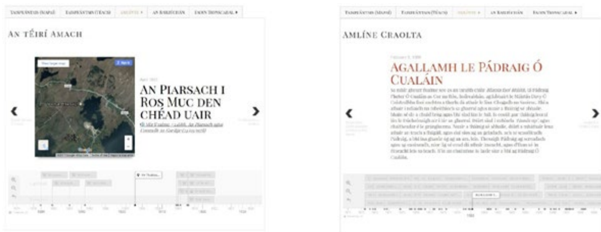
Figiúr 5: Dhá chineál amlíne sa taispeántas. Ar chlé tá amlíne ina bhfuil na heachtraí éagsúla a bhaineann leis an Éirí Amach luaite (mar a thagann siad aníos sa chartlann). Ar dheis tá sampla de mhír fuaimne mar a bhreathnaíonn sé ar an amlíne craolta.

I gcás an taispeántais seo, measadh go raibh cúpla sruth ama éagsúil i bhfeidhm san ábhar: an sruth teamparála ó 1913 go 1923 san ábhar féin, agus sruth croineolaíochta na craoltóireachta agus na cartlainne (ó 1972 ar aghaidh). 5 Dá shimplí atá siad, is ea is fearr a oibríonn amlínte mar uirlisí taiscéalaíochta. Ar an mbunús seo, socraíodh ceithre amlíne éagsúla a chruthú. Díríonn trí cinn acu – An tÉirí Amach, Cogadh na Saoirse agus an Cogadh Cathartha—ar eachtraí staire éagsúla ó na tréimhsí sin atá pléite ar mhíreanna fuaimne ó chartlann Raidió na Gaeltachta. Tugtar nasc chuig an mír/na míreanna fuaimne ina bhfuil tagairt déanta don eachtra, chomh maith le heolas breise faoin eachtra, i bhfoirm nasc Vicipéide, mapa nó íomhá. Taispeántar sa cheathrú hamlíne na míreanna fuaimne go léir san ord inar craoladh iad ar RTÉ Raidió na Gaeltachta. Tugtar nasc chuig an mír fuaimne chomh maith le cur síos gonta faoi ábhar na míre.