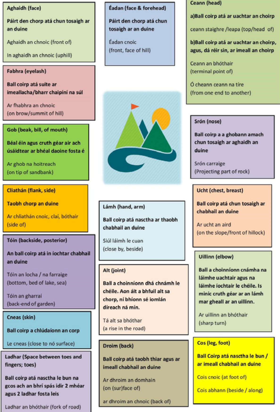
Léaráid a 2: Baill choirp an duine mar shuímh fhisiceacha sa Ghaeilge